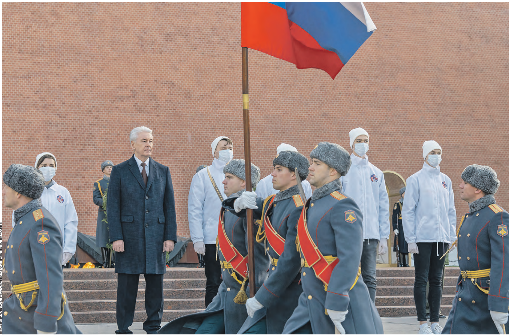
7 ноября 13:20 Мэр Москвы Сергей Собянин (слева, на втором плане) на мероприятии в честь 79-й годовщины Военного парада на Красной площади 7 ноября 1941 года